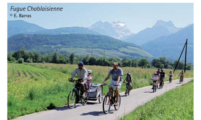
Fugue Chablaisienne