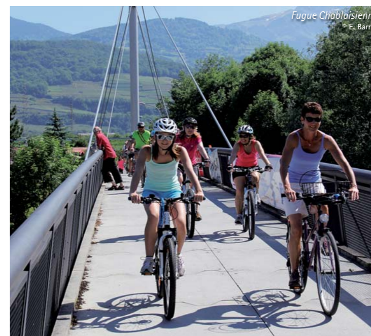
Fugue Chablaisienne © E. Barras