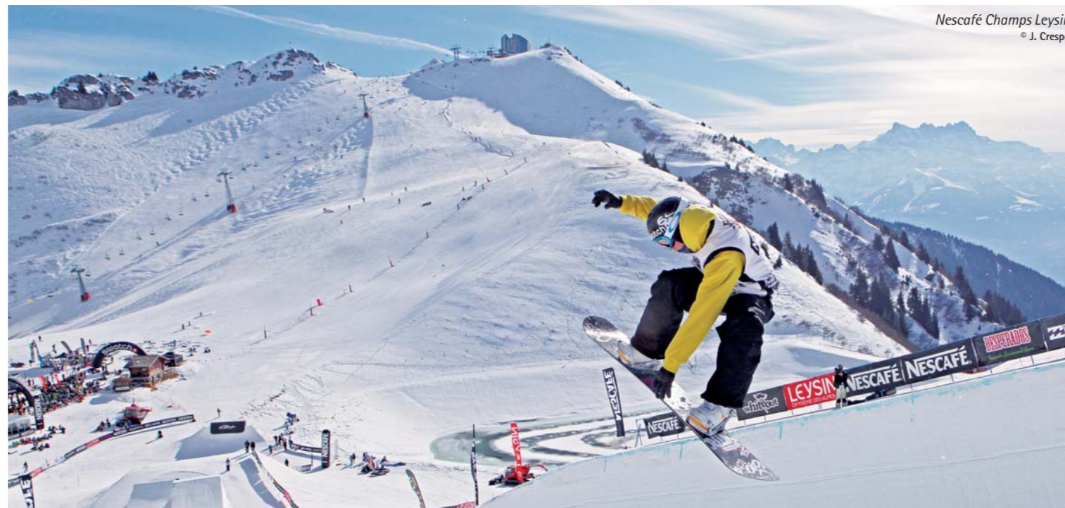
Nescafé Champs Leysin

Nous pensons que le sport peut être un important outil de développement économique pour le Chablais, notamment pour le domaine du tourisme. Siège de l'Union Cycliste Internationale (UCI), lieu d'accueil de nombreux événements sportifs de niveau régional, national et international et région très appréciée des sportifs avérés comme des amateurs pour la richesse de ses infrastructures sportives et la beauté de son paysage, notre région possède de nombreux atouts à faire valoir dans le sport. Le projet Chablais Sport vise à la mise en commun des ressources et à une meilleure coordination entre les différentes communes et centres sportifs actifs dans la région afin de renforcer la présence du Chablais à l'échelon romand, suisse et international. Nous proposons notamment de créer un réseau des principaux centres sportifs du