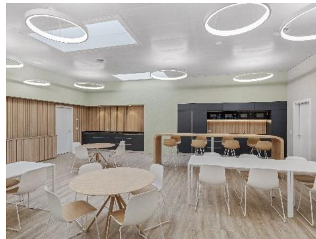
ARASAPE (Canton de Vaud)