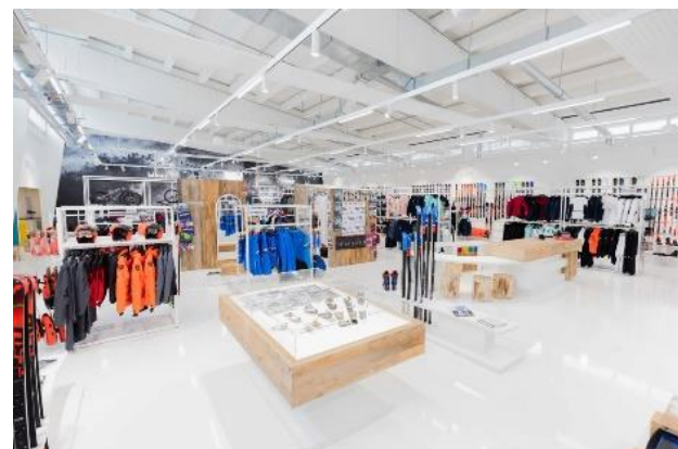
Rossignol (Magasin StartGate)