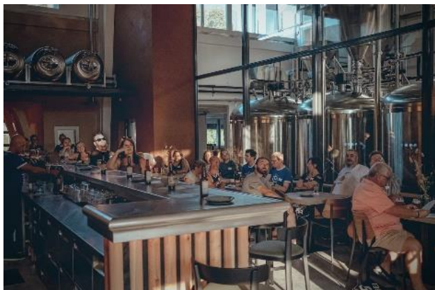
Brasserie La Mine